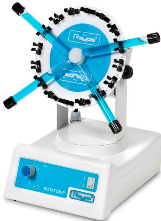
Rotatub-P + DICG-16